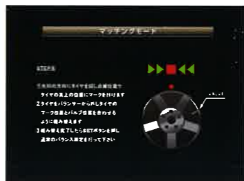
▲タイヤとリムの組み合わせにより最小アンバランスにするマッチング操作画面