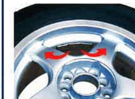
従来のウエイト貼付け

アルミ内面修正モードの際に、アウト側に貼り付けるウエイト量を2本のスポーク裏に分割して貼り付けることで、表から見えないようにする隠し貼り操作を行えます。