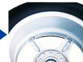
WASによる分割貼付け