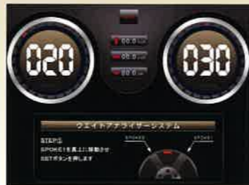
▲ウエイト分割貼り付け時のウエイトアナライザー操作画面