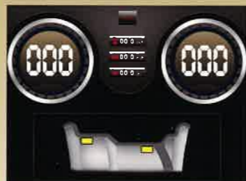
▲電源投入時の通常（アルミ貼り付けモード）画面

シンプルで見やすい液晶カラーディスプレイにより各操作を手順をおって表示しますので容易な作業を行えます。